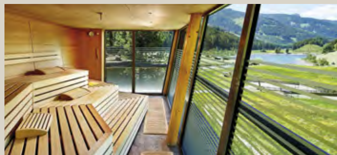
Saunagenuss mit Bergblick im Almhof Family Resort & SPA in Gerlos im Zillertal – Wellnessmomente für Eltern nach einem aktiven Familientag.

Gemeinsame Familienmomente genießen: In den Original Kinderhotels Europa stehen unbeschwerte Urlaubstage für Groß und Klein im Mittelpunkt.