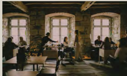
Die Gaststube – Herzstück der 1280 Krone für Genuss von früh bis spät.